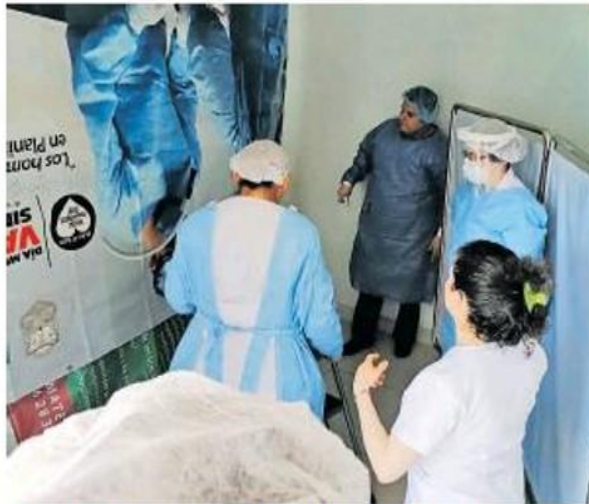
El personal de salud tendrá un respiro después de nueve meses

EL PACIENTE en casa debe realizar estornudo de etiqueta, bañarse de forma diaria y continuar monitoreando su temperatura